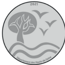
Ex : médaille Biodiversité