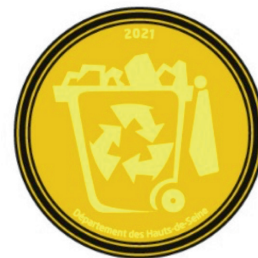
Ex : médaille Economie Circulaire

En complément, pour chaque édition, un Prix du jury de 5 000€ récompense l'action, présentée par les élèves , qui aura le plus convaincu. Téléchargement du dossier en décembre sur www.hauts-de-seine.fr , dépôt entre décembre et mars sur les-meddailles@hauts-de-seine.fr .