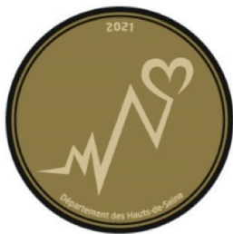
Ex : médaille Santé/Bien-être