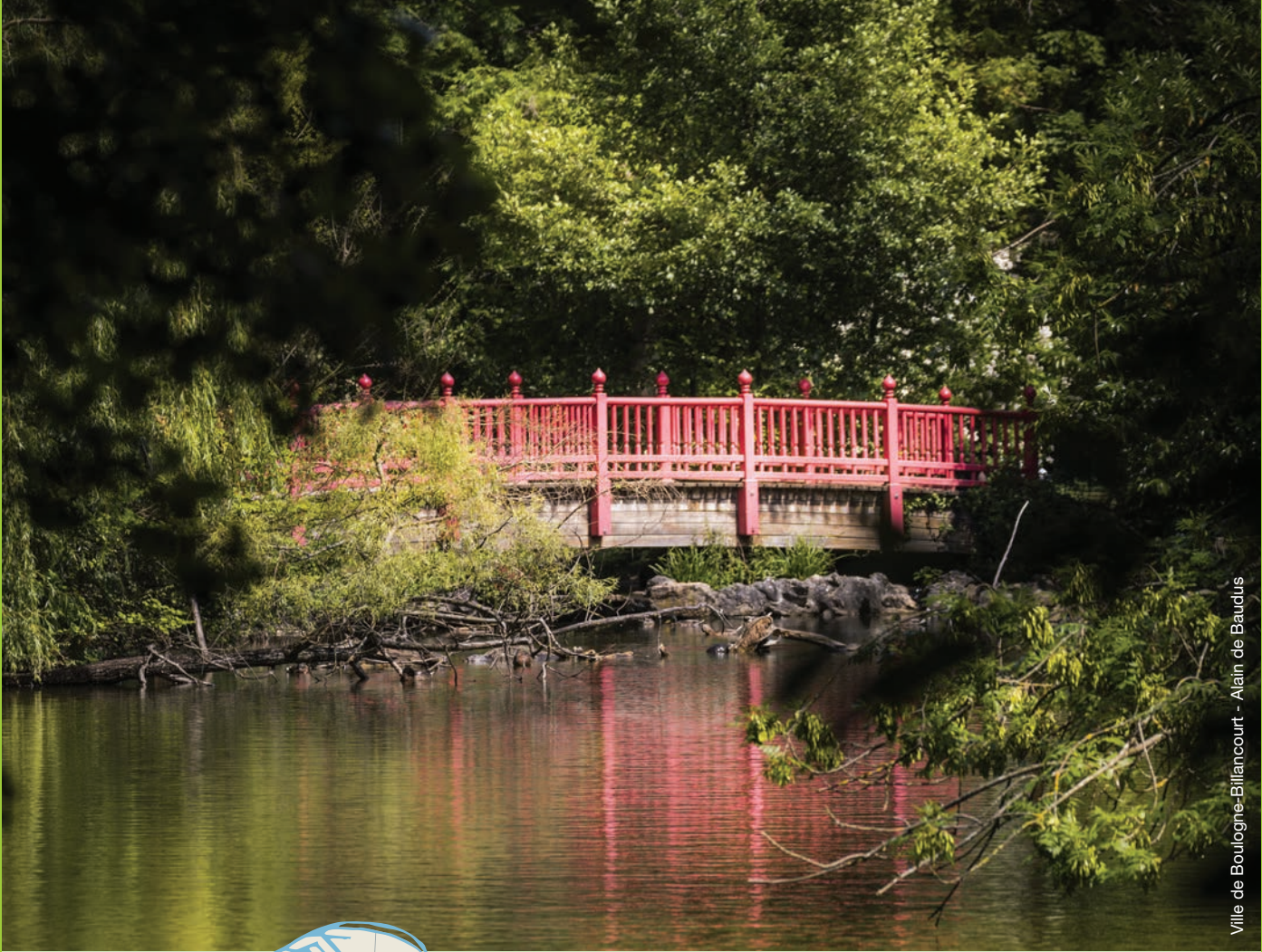
Ville de Boulogne-Billancourt - Alain de Baudus