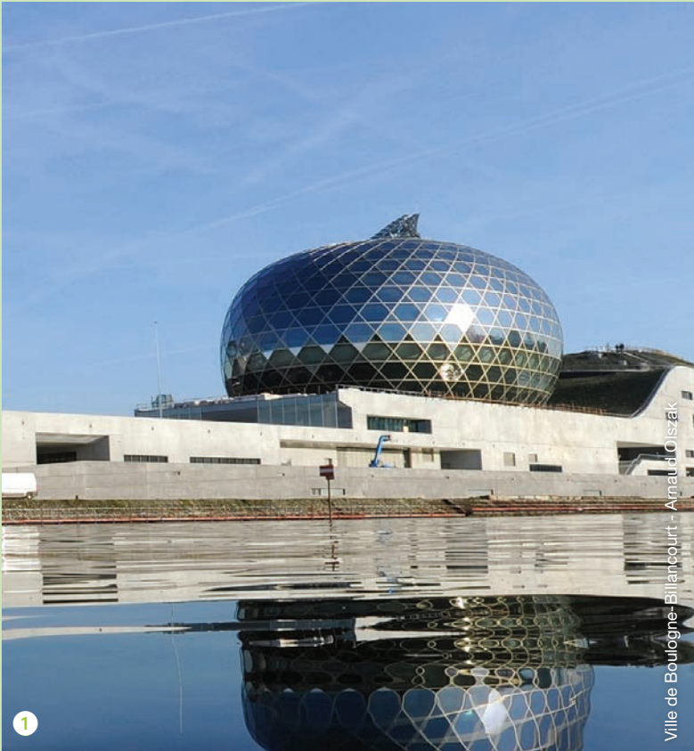
Ville de Boulogne-Billancourt - Arnaud Olszak