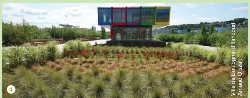
Ville de Boulogne-Billancourt - Arnaud Olszak