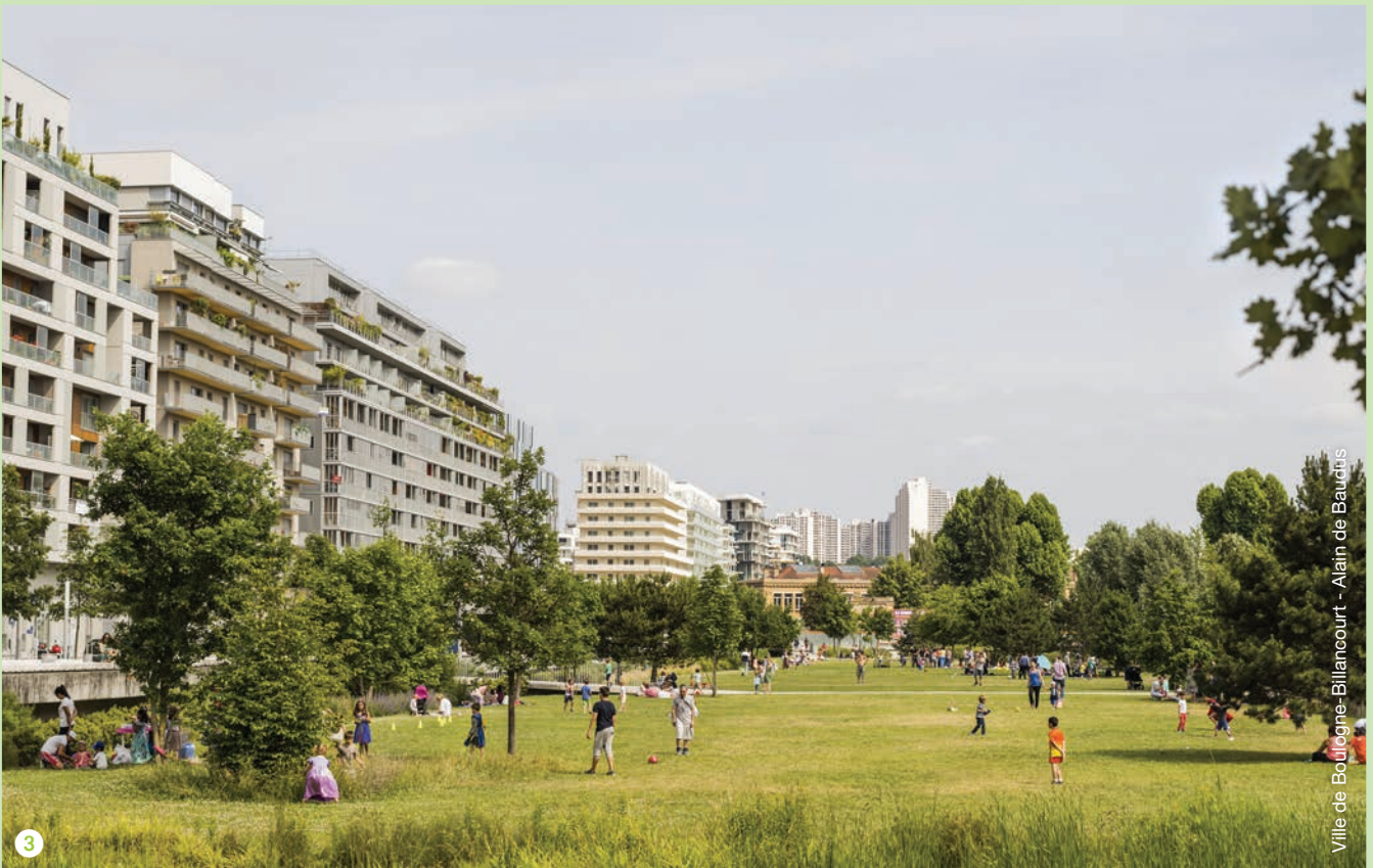
Ville de Boulogne-Billancourt - Alain de Bauduis